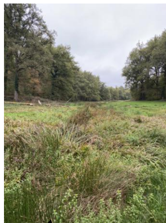
Vue alimentation par cours d'eau faible débit en zone humide du cours d'eau