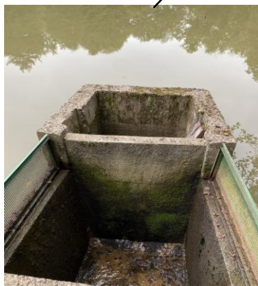
Moine à refaire notamment remplacer le mur intérieur par des planches amovibles.